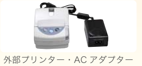
外部プリンター・AC アダプター