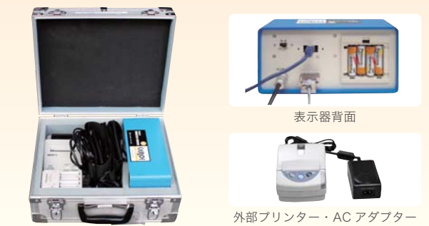
表示器・付属品 (運搬ケース収納時)