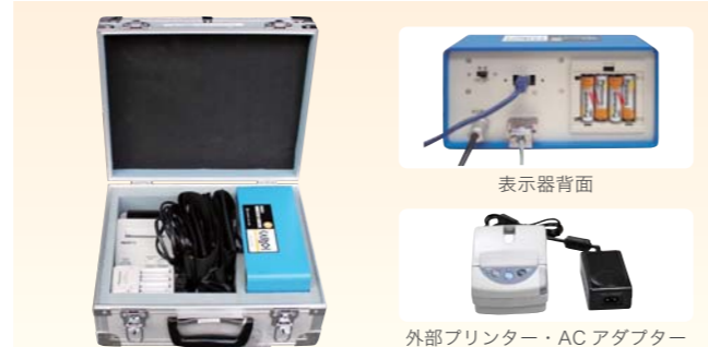
表示器・付属品 (運搬ケース収納時)