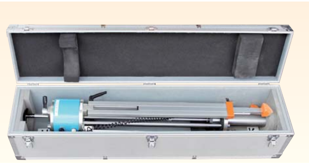
本体 (運搬ケース収納時)

社団法人日本材料学会 平成 14 年 2 月 13 日 技術評価証第 1004 号